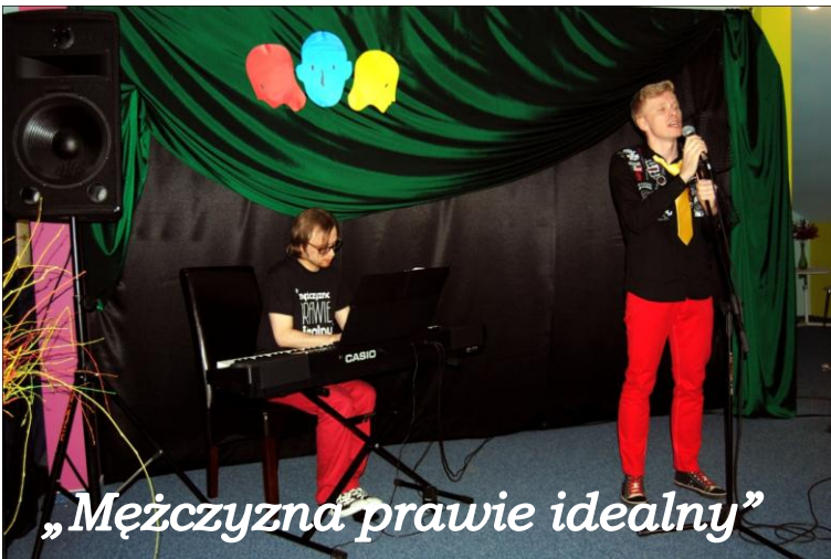
„Mężczyzna prawie idealny”