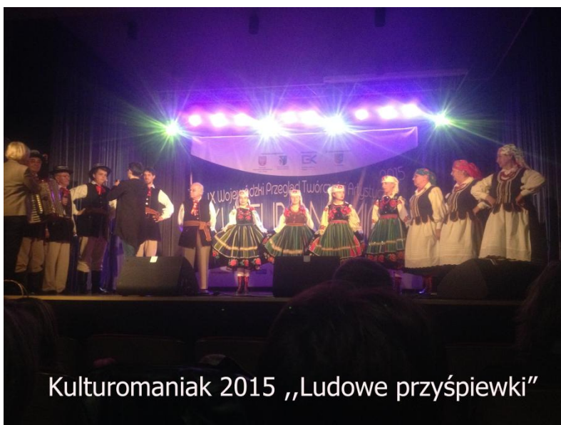
Kulturomaniak 2015 „Ludowe przyśpiewki”

✓ Międzypokoleniowy Zespół Razem swoją działalność opiera na tradycji, obyczajach ludowych, zwyczajach regionalnych i folklorze, dlatego między innymi opracowuje na scenę widowiska obrzędowe. Ma w swoim repertuarze obrzędy rodzinne z tytułu wesela: swaty, zaślubiny, oczepiny przenosiny oraz chrzciny, obrzędy obyczajowe: dożynki, Święto Plonów i Chleba oraz zwyczajowe: wyzwoliny kosiarza, kisenie kapusty. Corocznie przygotowywane jest nowe widowisko na konkursy i przeglądy oraz na występy dla społeczności lokalnej. W tym roku zespół pokazał widowisko „Jak Marysia kapustę deptała” czyli obrzęd kisenia kapusty w Warszawie – Włochy na Przeglądzie Twórczości Artystycznej Seniorów zdobywając I miejsce , a konkurencja była ogólnopolska. W maju ten sam spektakl pokazano na Przeglądzie Artystycznym